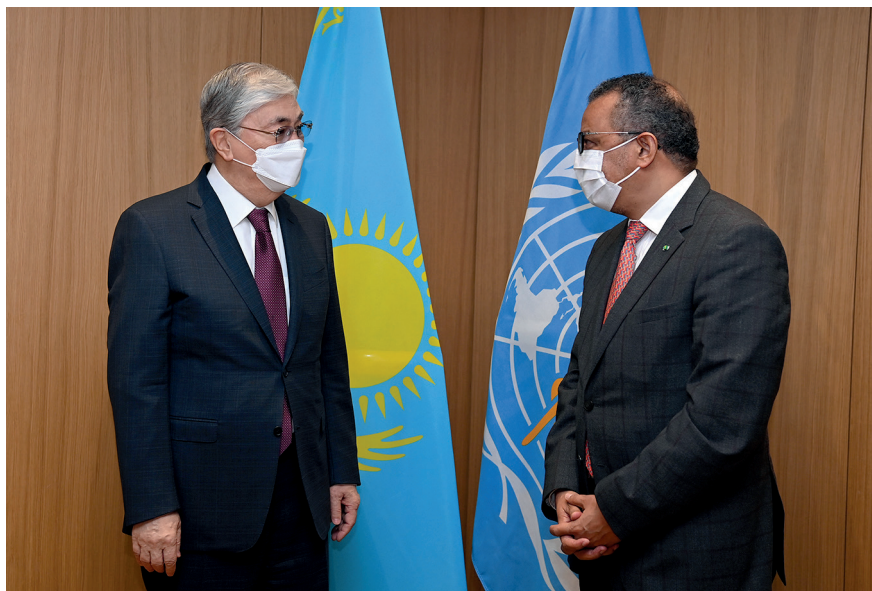
Встреча с Генеральным директором ВОЗ Тедросом Адханомом Гебрейесусом. Женева (Швейцария), 29 ноября 2021 г.