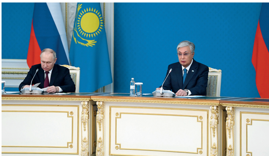
Президенты Казахстана и России участвуют в пленарном заседании XIX Форума межрегионального сотрудничества Казахстана и России. Астана, 9 ноября 2023 г.