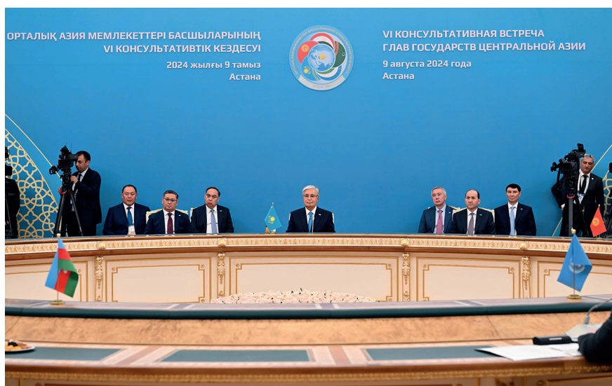
Председательство на VI Консультативной встрече глав государств Центральной Азии. Астана, 9 августа 2024 г.

Исторически Центральная Азия была мостом между цивилизациями. Сегодня у региона есть все шансы стать не просто перекрестком торговых путей, но и самостоятельным центром силы – при условии сохранения единства, стабильности и взаимного доверия.