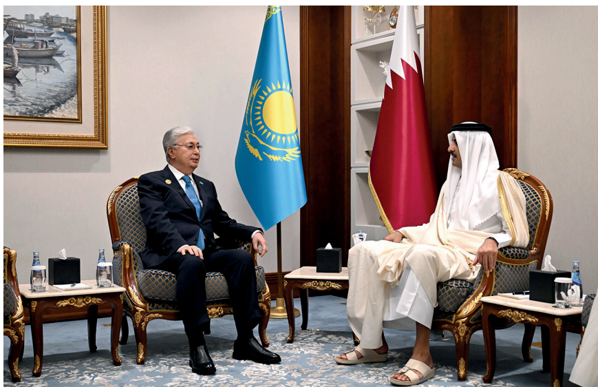
Переговоры с Эмиром Катара шейхом Тамимом бен Хамадом Аль Тани. Доха (Катар), 7 декабря 2024 г.