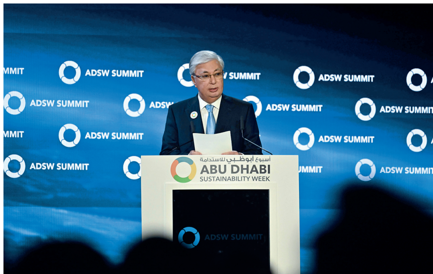
Выступление на саммите «Неделя устойчивого развития Абу-Даби». Абу-Даби (ОАЭ), 14 января 2025 г.

Таким образом, климатическая дипломатия Токаева – это не изолированное направление, а часть стратегической концепции, где переплетаются рациональность, ответственность и солидарность. Казахстан не просто адаптируется к изменениям – он предлагает миру модель устойчивого развития, где климатическая повестка служит прогрессу. Это пример того, как страна может превратить вызовы в возможности, что лидерство начинается с готовности брать на себя ответственность. Казахстан не только защищает свои интересы, но и формирует контекст будущего, где стабильность, процветание и забота о планете идут рука об руку.