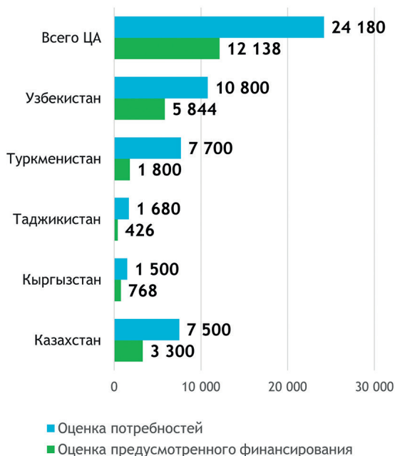
Рисунок 1. Оценка дефицита финансирования в ЦА, млн долл. и в %, 2025–2030 гг.