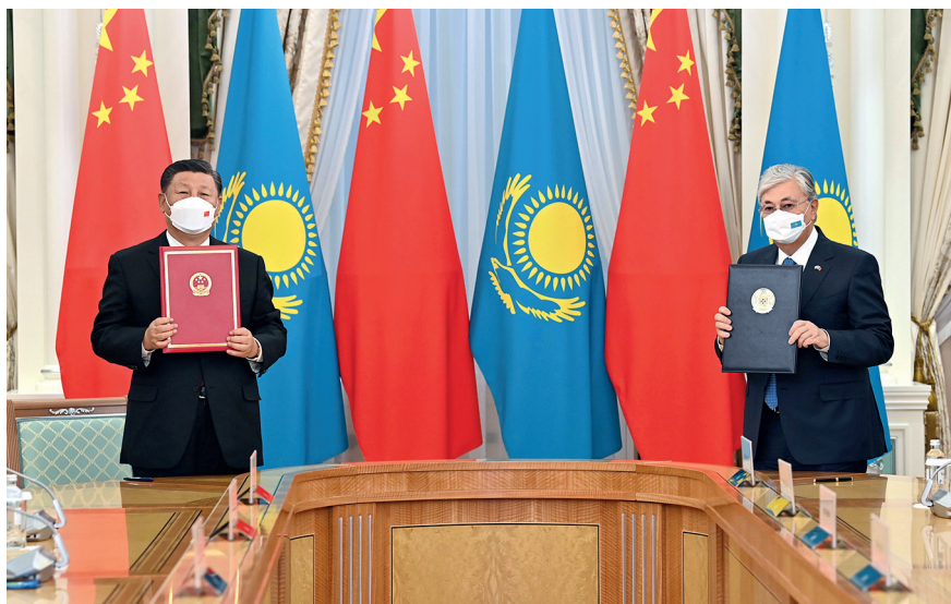
Встреча с Председателем КНР Си Цзиньпином. Астана, 14 сентября 2022 г.