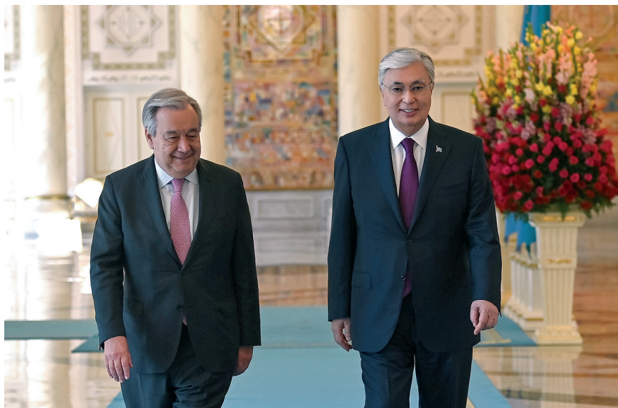
Переговоры с Генеральным секретарем ООН Антониу Гутерришем. Астана, 3 июля 2024 г.