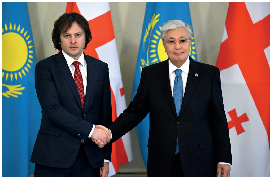
Переговоры с Премьер-министром Грузии Ираклием Кобахидзе. Астана, 6 февраля 2025 г.