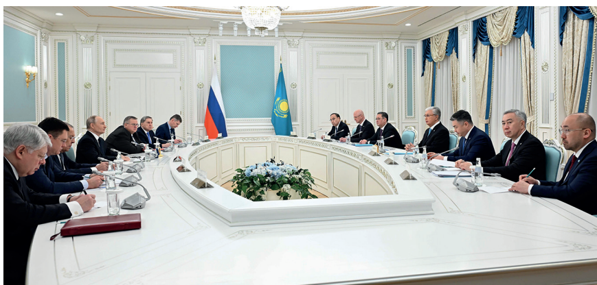
Переговоры с Президентом России Владимиром Путиным в узком составе. Астана, 27 ноября 2024 г.