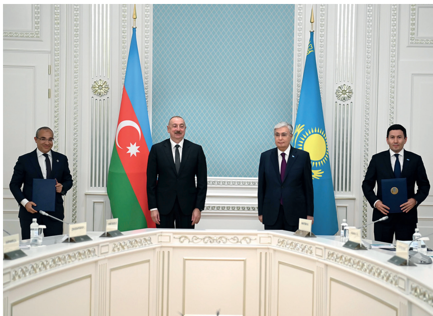
Встреча с Президентом Азербайджана Ильхамом Алиевым. Астана, 3 июля 2024 г.

Каспийским и Черным морями. Дальнейшее развитие событий на Южном Кавказе будет иметь прямые последствия для всего Евразийского региона, а роль Казахстана как конструктивного и заинтересованного соседа останется весьма значимой.