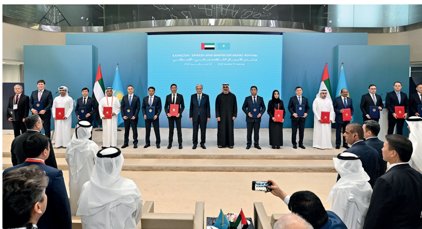
Участие вместе с Наследным принцем Абу-Даби шейхом Халедом бен Мухаммед бен Заид Аль Нахаяном в работе бизнес-форума «Казakhstan – Объединенные Арабские Эмираты». Астана, 12 мая 2025 г.