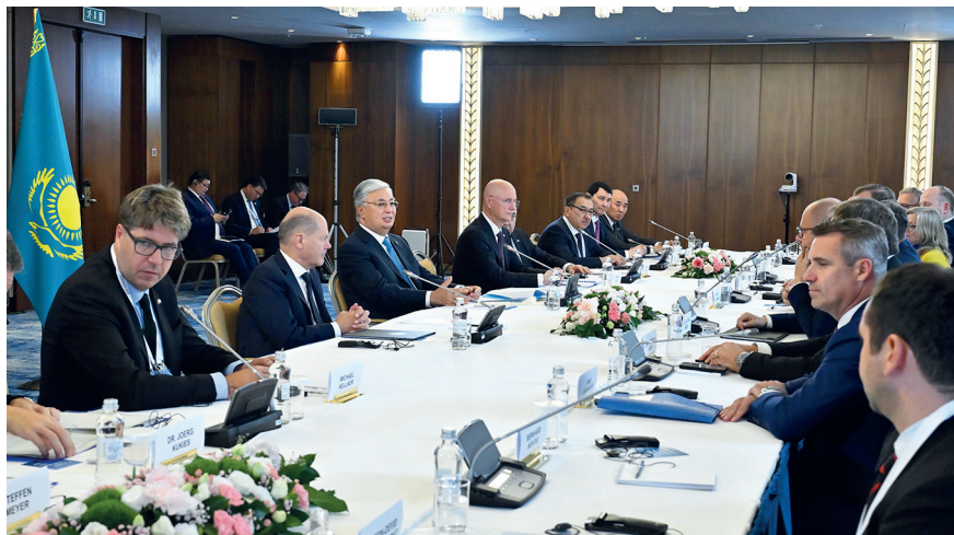
Встреча с капитанами бизнеса Германии. Берлин (Германия), 16 сентября 2024 г.

Тем не менее текущая траектория сотрудничества свидетельствует: Казахстан смог превратить геополитический кризис в возможность. Оставаясь нейтральным в конфликте Запада с Россией, он укрепил свои позиции как мост между Европой и Азией. Успех этой стратегии в долгосрочной перспективе будет зависеть от того, сможет ли страна перейти от роли поставщика сырья к статусу технологического хаба, сохранив при этом многовекторность в условиях нарастающей полноты мира.