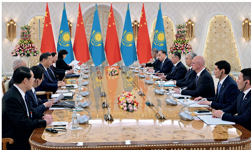
Переговоры с Председателем КНР Си Цзиньпином в узком формате. Астана, 3 июля 2024 г.