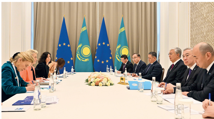
Переговоры с президентом Европейской комиссии Урсулой фон дер Ляйен на полях саммита «Центральная Азия – Европейский Союз». Самарканд (Узбекистан), 3 апреля 2025 г.