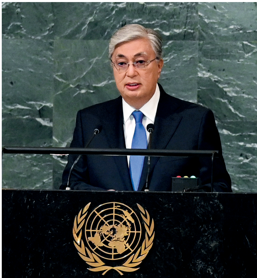
Выступление на общих дебатах в рамках 77-й сессии Генеральной Ассамблеи ООН. 20 сентября 2022 г.

Дальнейшая траектория этих отношений будет зависеть как от способности Астаны продолжать свой сбалансированный курс, так и от готовности самой системы ООН к адаптации и реформам, к которым настойчиво призывает Казахстан.