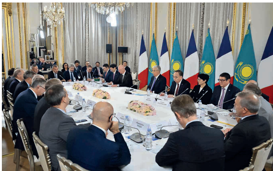
Встреча с капитанами бизнеса Франции. Париж (Франция), 5 ноября 2024 г.