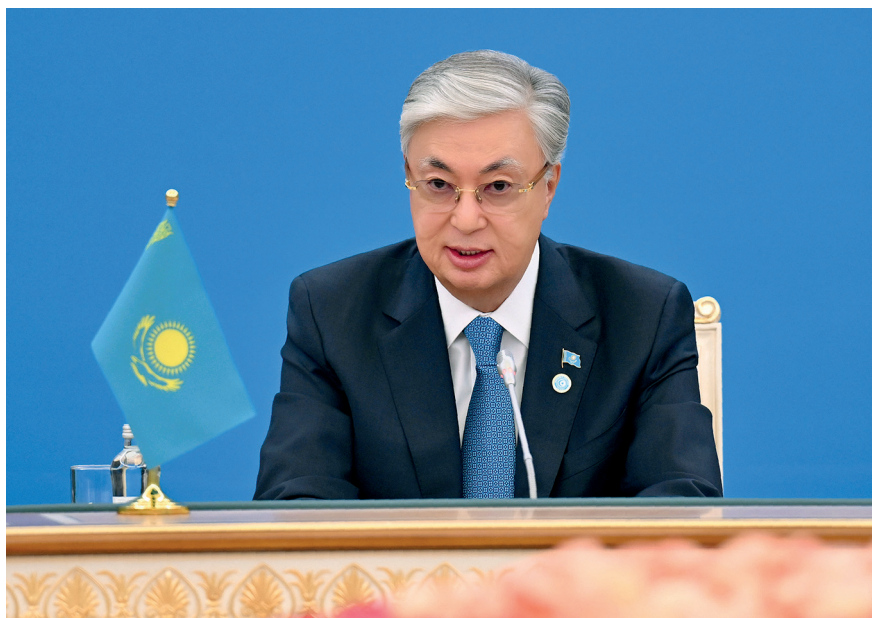
Президент Касым-Жомарт Токаев председательствует на X саммите Организации тюркских государств. Астана. 3 ноября 2023 г.

вами. Тем не менее само существование и активное развитие организации свидетельствуют о растущей субъектности тюркских государств и их решимости играть более значимую роль в формировании будущего Евразии, используя ОТГ как один из ключевых механизмов для навигации в сложном и быстро меняющемся мире. Для казахстанской дипломатии это участие остается безальтернативным элементом стратегии по обеспечению и продвижению национальных интересов в XXI веке.